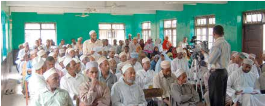
Offentligt dialogmøde Wete, Pemba, 22. april 2008.

I hver komité skulle der være seks muslimer, tre kristne, tre kvinder