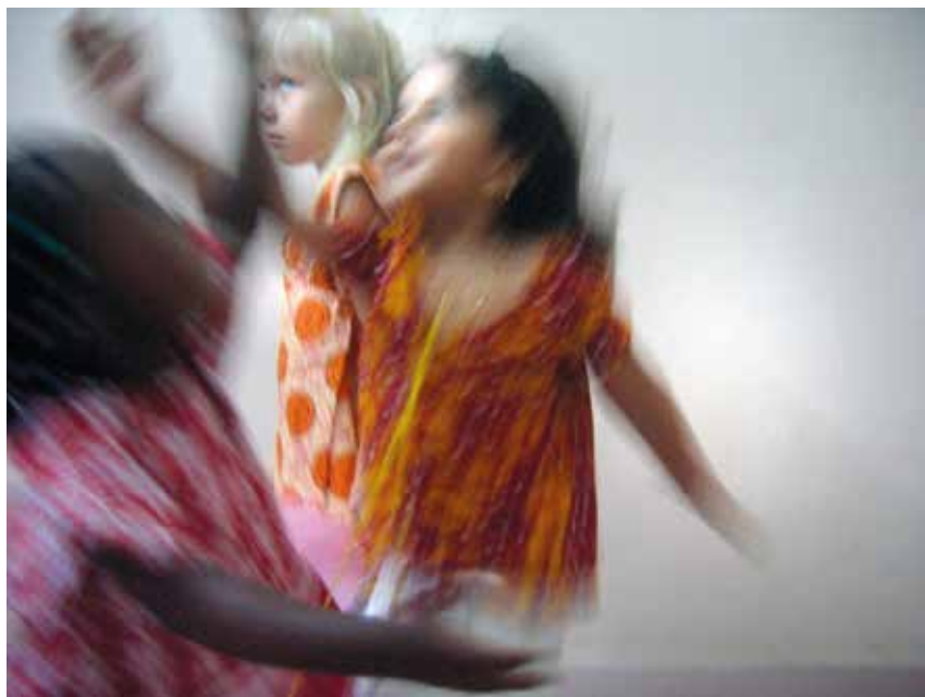
Markedsføringsbillede af Upendos kollektion 2007

til salg på turistmarkedet. Dermed er man kommet vidt og bredt ud med budskabet: United in a vision for a better world, Clothing with a message, Upendo means Love . Markedsføring og salg har været en del af helheden siden 2007.