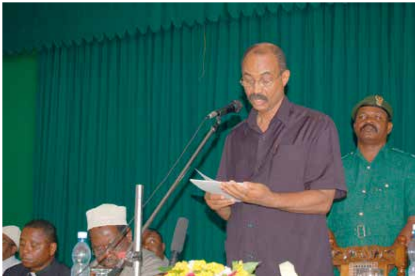
Præsident Amani Abeid Karume takker fredskomiteén til offentligt dialogmøde 3. maj 2006.

at fremme fred. 31 I hans tale, hvor han nævnte personlige erfaringer og internationale begivenheder, understregede han vigtigheden af fredelige relationer på tværs af religiøse forskelle. Han citerede fra Bjergprædikenen: “Salige er dem, der skaber fred ... de skal arve jorden.” (Mt 5:9 & 5:5). Mødet blev således både en evaluering, en anerkendelse af komitéens indsats for fred siden stiftelsen, samt en opfordring til at fortsætte.